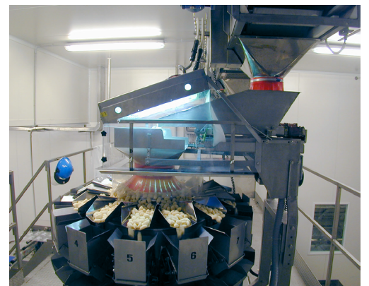
Applicazione in un ambiente industriale

La tecnologia UV-C è un metodo di disinfezione fisico con un ottimo rapporto costi/benefici, è ecologico e, al contrario degli agenti chimici, funziona contro tutti i microrganismi senza creare resistenze.