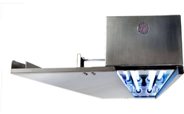
Modello con shutter (-SH)

UV-TEAM-A è costruito interamente in Italia, con materiali di alta qualità ed estremamente resistenti.